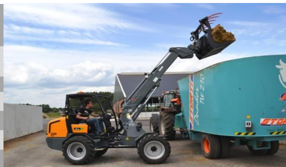
Zobrazený stroj se může lišit od standardní konfigurace